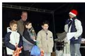
Les vainqueurs de la 3 ème course

Lorsque l' on a cent ans, il est tout à fait normal de faire partager son expérience, c' est ce qui s' est passé ce dimanche, entre la Marne et la fausse Marne à Château-Thierry.