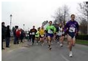
Départ de la 5ème course