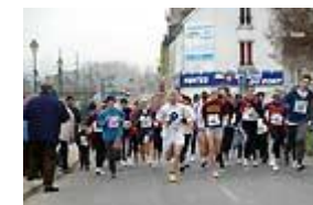
Départ de la 4 ème course