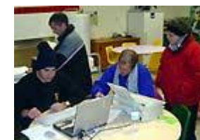
Résultats rapides, grâce à l'informatique