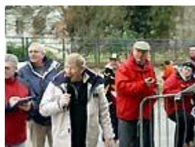
Commentaires et contrôles

Un circuit d' un kilomètre, partant de la Place Thiers, passant par la rue des écoles, puis la rue Paul Doucet, rue des granges, le quai coutellier, la rue Carnot, la place du Maréchal Leclec et retour place thiers, a permis à deux cent seize coureurs de se rencontrer, lors de la sixième course de Noël organisée par l' Athletic Club de Château-Thierry ( A.C.C.T. ).