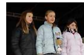
Les trois premières cadettes

Trente Benjamins, et Benjamines, accompagnés des Minimes féminines, se sont