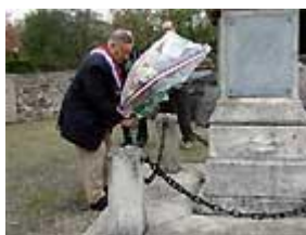
Dépôt de gerbe