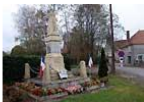
Monument aux Morts de Fontenelle en Brie

Pour clore la cérémonie, un vin d'honneur était offert par la Municipalité.