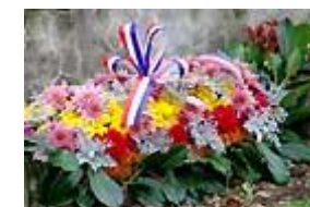
La gerbe du souvenir