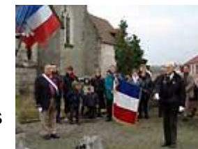
Minute de silence