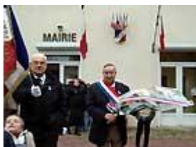
Départ de la Mairie

C' est en début d' après-midi qu' à Artonges, s' est déroulée la cérémonie du souvenir de l' armistice du 11 novembre 1918.