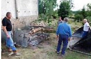
L'équipe de cuisson