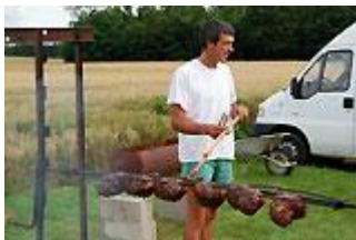
Autour des gigots