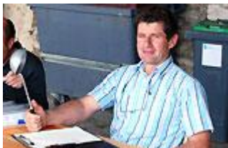
Un Président heureux