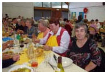
Une table éloquente