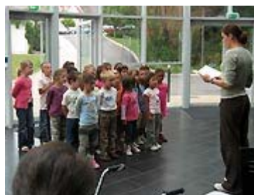
La musique c'est sérieux!