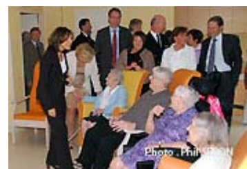
Mais que faites vous?