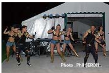
Danseuses et danseurs