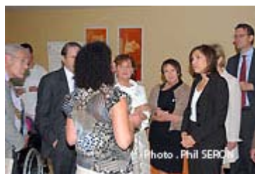
Un peu de technique