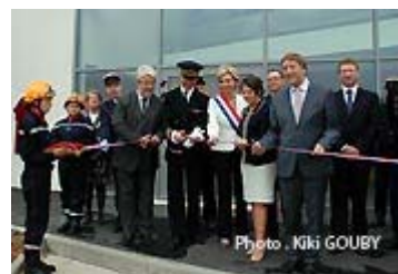
Ouverture officielle du nouveau centre principal