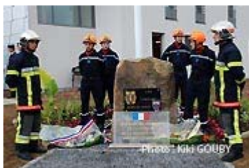
Salut au drapeau après la remise de la médaille de bronze