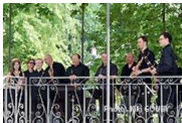
Les musiciens sous le kiosque

Un pari très réussi pour les élèves musiciens que le succès de cette prestation devrait encourager à recommencer.