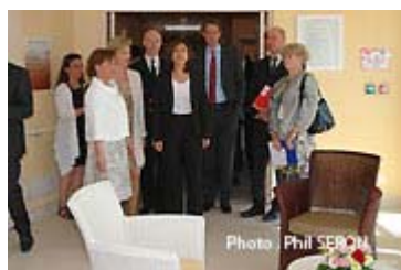
Visite d'un salon