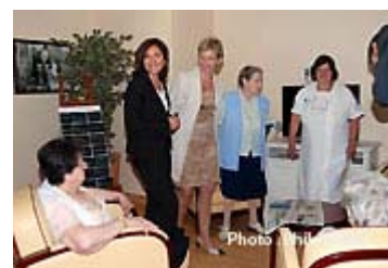
Salon de lecture