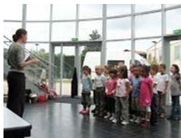
Les premières notes