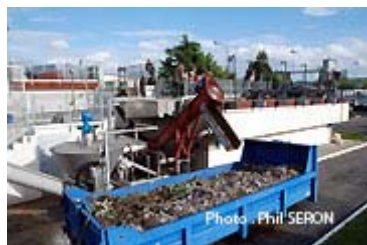
Collecte des déchets lourds

Rendez vous donc, l'année prochaine pour une visite de la nouvelle station d'épuration.