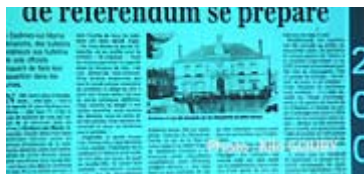
Tout est parti de là