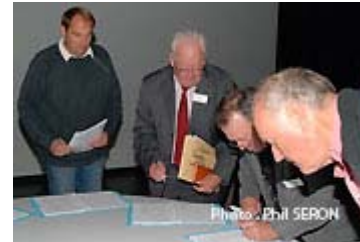
C'est le moment de la signature