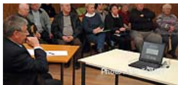
On est attentif