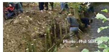
Démonstration de tressage