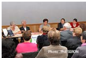
Public très attentif