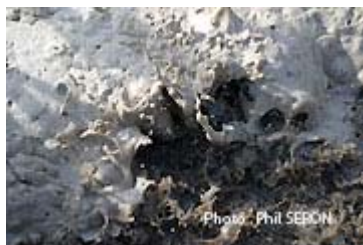
Les boues sont séparées