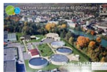
Future station d"épuration