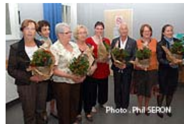
Fleurs pour les animatrices et bénévoles