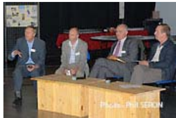
Les explications sont nombreuses