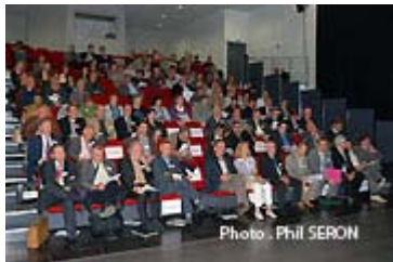
Les gradins sont pleins