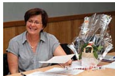
Une Présidente heureuse