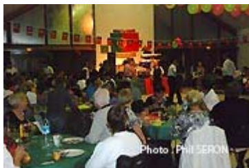
Vue de la salle