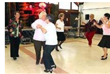
La piste de danse est toujours aussi attirante

Ce samedi soir, Charly sur Marne était à l'heure du loto, organisé par l'association Charly Animations Loisirs .