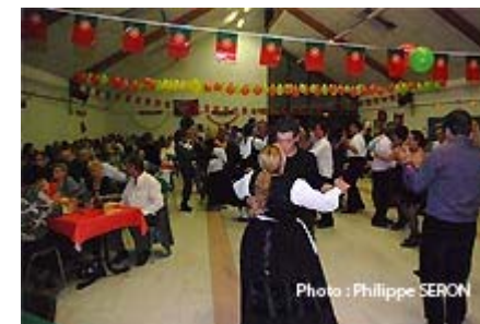
Danses en costumes

Cuisine Espagnole, ce samedi soir, à la salle polyvalente de Saulchery, pour la soirée paella organisée par l'association Saulchery Loisirs .