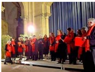
Ca swing sur scène