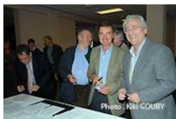
Tout le monde est prêt

Moment important dans le bâtiment L de l'Hôpital de Villiers Saint Denis, ce premier octobre, pour la signature d'une convention de coopération entre les établissements privés de Reims; la Polyclinique des Bleuets, la polyclinique de Courlancy, la polyclinique de Saint-André et la Fondation Renaissance Sanitaire, gestionnaire de l'Hôpital de Villiers Saint Denis.