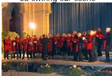
Un ensemble impressionnant

mais sans doute comptait-elle sur ces 250 choristes pour la réchauffer un peu. Qu'importe, les organisateurs, avaient tout mis en œuvre pour que chanteurs et accompagnateurs se sentent à l'aise. A l'entrée, le livre sur les calvaires de l'Aisne, édité par l'USAA, était proposé aux visiteurs, au profit de la recherche sur la maladie d'Alzheimer .