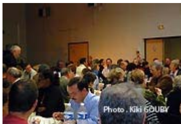
La paëlla est servie