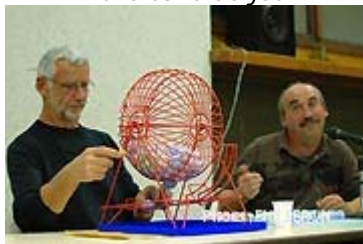
On tire les numéros

Une heure avant le début du jeu, à l'ouverture des portes, la salle des Illettes prenait vie, par l'achat des cartons et choix des places autour des tables de jeu. A 20h30, premier tour de roue et c'est parti pour douze parties, entrecoupées de deux pauses.