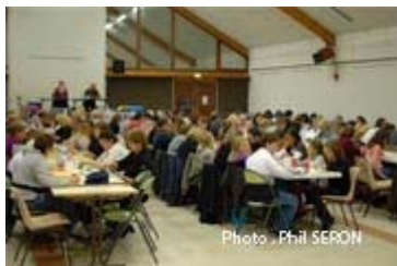
Belle salle de jeu