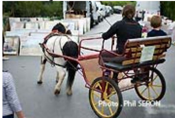
Promenades en calèche

précédente, fut invitée à récidiver. « Je n'ai pas répété », se défendait-elle, mais ne se fit pas beaucoup prier pour entonner « Fais du feu dans la cheminée... » que la salle reprenait en chœur.