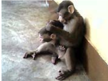
Golum et Bilbo