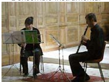
Partie de flutes

Comme à l'habitude, plus une seule place assise dans l'église, la recette de la manifestation étant d'ailleurs destinée à aider à la restauration de l'édifice.