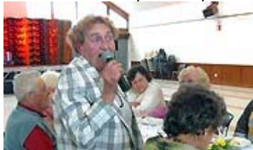
Tout fini en chansons

Pour ce mardi 13 octobre les anciens étaient réunis salle des Illettes pour leur repas annuel.