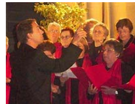
Le chœur répond au chef