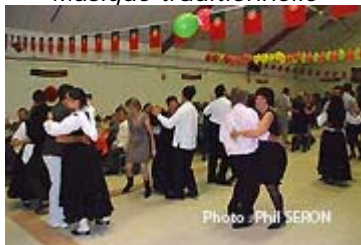
Affluence sur la piste

Petits plats dans les grands, pour la soirée Portugaise organisée par Charly Animations Loisirs , ce samedi soir dans la salle des Illettes à Charly sur Marne.