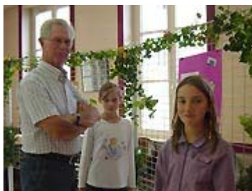
Monsieur le Maire est attentif