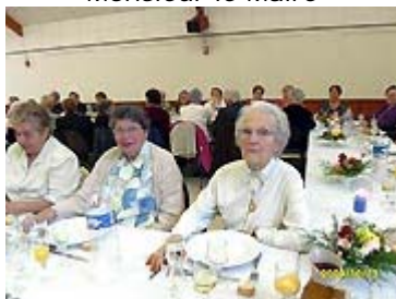
On est sérieux pour la photo