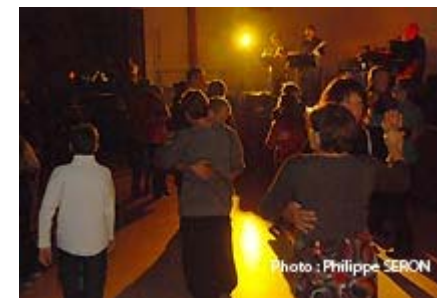
Moment de danse

Prochaine manifestation le samedi 12 décembre, pour la visite du Père Noël aux enfants de la commune.