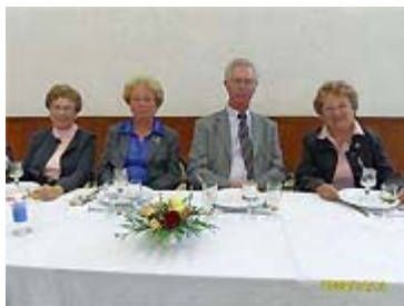
Monsieur le Maire