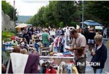
Toujours la brocante