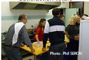
En cuisine, on s'active

Si, dans les cuisines, on s'activait pour mettre en assiettes, la paëlla aux fumets attirants, dans la salle, régnait une belle agitation provoquée par les musiciens de l'orchestre "Foint de", interprétant les plus grands succès de variétés, entraînant les danseurs en tout genre sur la piste. La faim se faisant sentir, les danseurs se retrouvèrent à table pour y déguster, un peu avec les doigts, les langoustines et gambas du plat principal. La dernière bouchée de riz rond avalée, la piste retrouvait les danseurs qui ne voulaient pas perdre un instant des rythmes de l'orchestre.